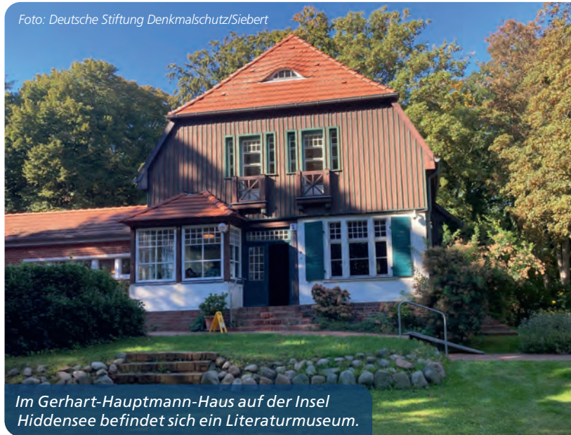
Im Gerhart-Hauptmann-Haus auf der Insel Hiddensee befindet sich ein Literaturmuseum.