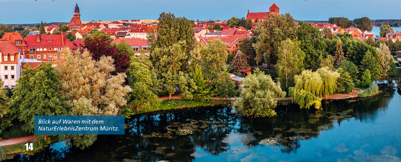
Blick auf Waren mit dem NaturErlebnisZentrum Müritz.